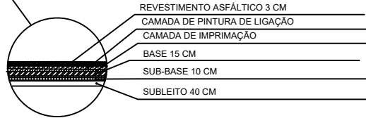
DETALHE 01 -CORTE CAMADAS